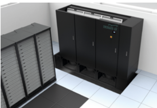
Präzisionsklimageräte der G-Serie für Datenzentren der neuesten Generation