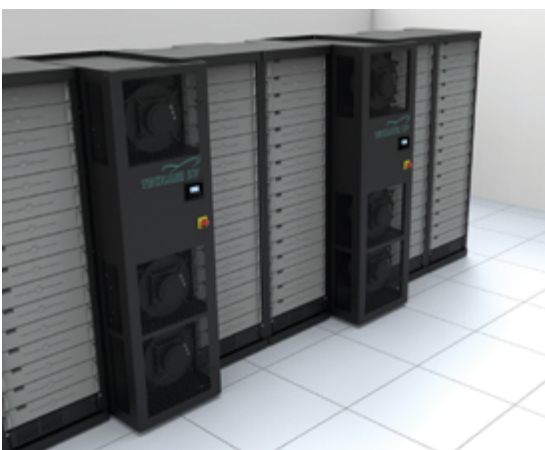
Präzisionsklimageräte der G-Serie für die Installation neben den Racks eines Datenzentrums