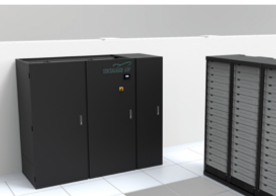
Präzisionsklimageräte der P-Serie für Räume mit sensiblen thermischen Lasten

Die Ventilatoren der neuesten Generation sorgen für höchste Leistungen bei minimalem Energieverbrauch. Zudem können die wassergekühlten Einheiten der Präzisionsklimageräte von TECNAIR LV mit elektronisch gesteuerten Ventilen ausgestattet werden, die die Regelung und die kontinuierliche Überwachung der Wassermenge, der Temperaturen im Ein- und Ausgang und der abgegebenen Kälteleistung gestatten. Die Direktverdampfungseinheiten der Präzisionsklimageräte sind mit elektronischen Expansionsventilen ausgestattet, um die Leistung des Kältekreislaufes vor allem im Teillastbetrieb zu maximieren. Außerdem sind die Direktverdampfungs-Präzisionsklimageräte mit Standard-Verdichtern ausgestattet, sind aber ebenso mit Inverter geregelten DC-Verdichtern erhältlich. Diese ermöglichen es, die abgegebene Kälteleistung zu variieren, indem die Motorleistung maximiert und der Energieverbrauch reduziert werden.