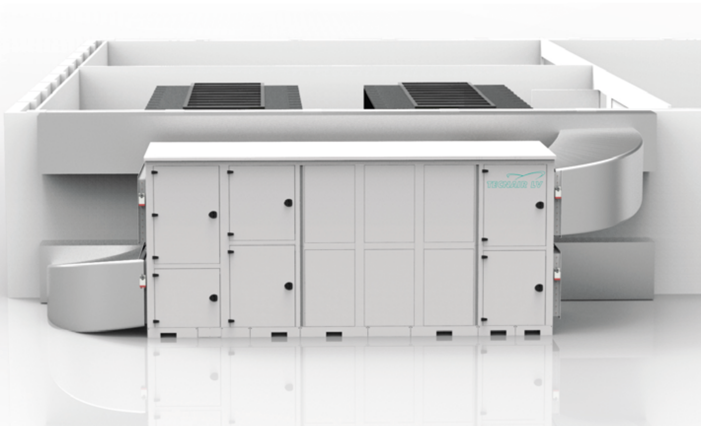
Free-Cooling-Klimageräte der F-Serie mit adiabatischer Kühlung