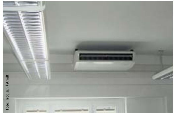
Bild 4 Einsatz von Unterdeckengeräten in einem Seminarraum (links falsche, rechts richtige Anordnung)