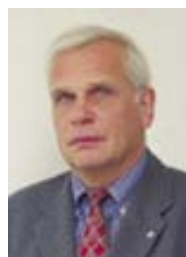
Prof. Dr.-Ing. Achim Trogisch lehrt an der Hochschule für Technik und Wirtschaft Dresden (FH) im Fachbereich Maschinenbau/Verfahrenstechnik auf dem Gebiet TGA.

Begrüßenswert ist, dass in [3] eine Eingliederung in die Systematisierung der Klimatisierungssysteme erfolgt ist und somit die Chance gegeben ist, dass dieses System als eine Bereicherung der Lösungen zur Gewährleistung behaglicher Raumklimabedingungen gesehen wird, insbesondere unter den Aspekten der Modernisierung und Variabilität der Nutzung von Räumen bzw. Gebäuden. ←